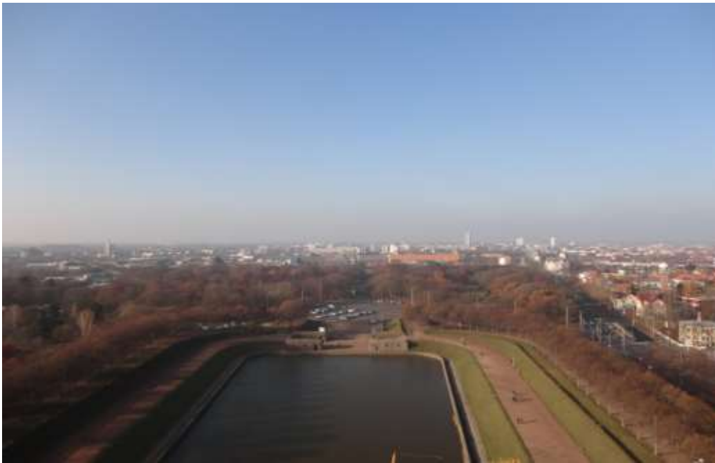
Leipcigo miesto vaizdas

Gal stažuotė nebūtų tokia įsimintina ir įdomi, jei nebūtų buvę pramogų. Savaitgalinių ekskursijų metu po Leipcigo ir Drezdeno miestus gidas mus supažindino su Vokietijos kultūra, architektūra bei jų istorija, vietinėmis tradicijomis, kasdieniniu gyvenimu.